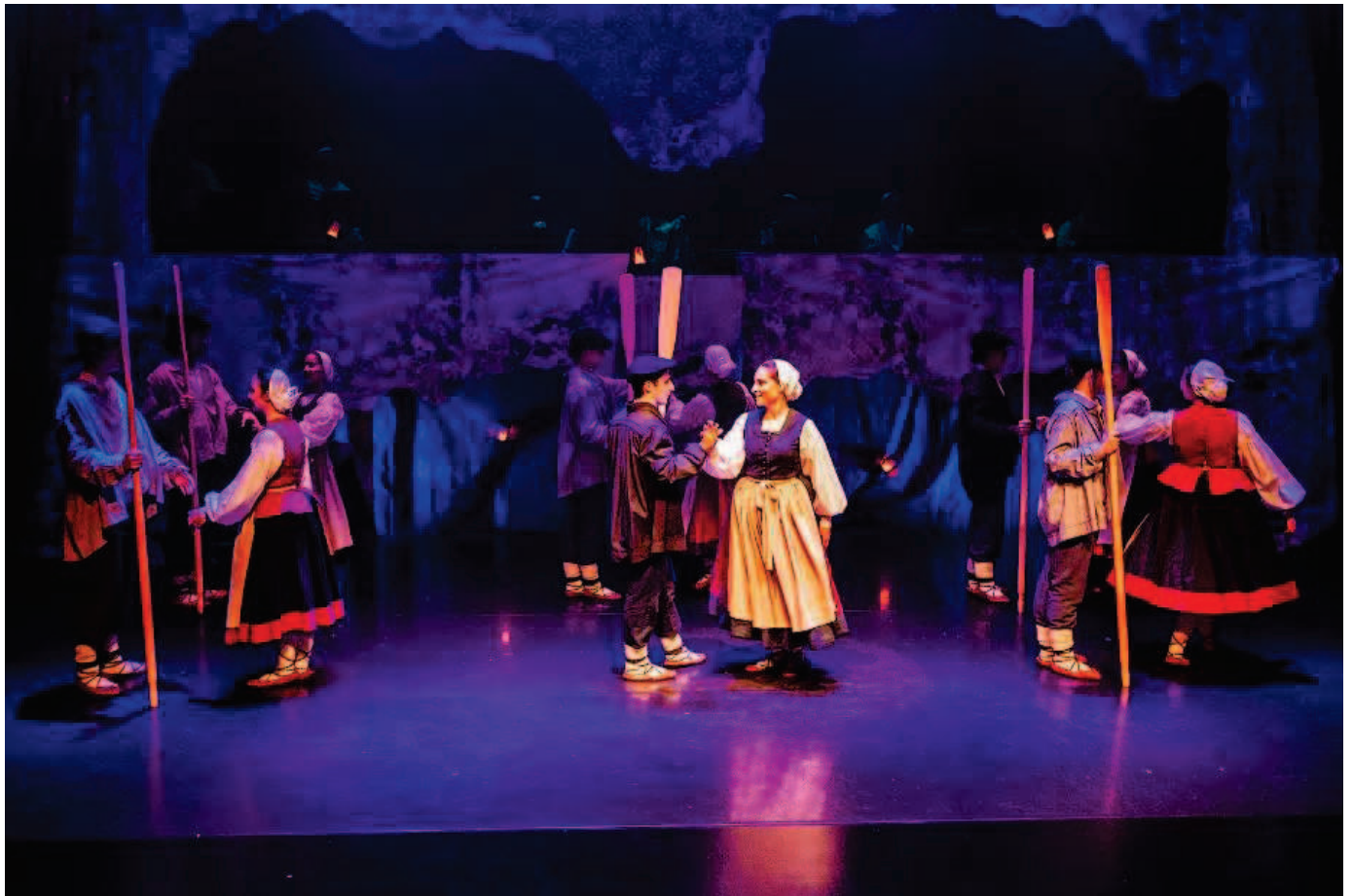
Imagen de la obra.

Gero Axular Dantza Taldea lleva a escena por primera vez este sábado su nueva creación, 'Higa'. Al igual que en obras anteriores, el espectáculo se inspira en un pasaje histórico irónico de la cultura vasca y lo relaciona con cuestiones candentes en la sociedad actual, tratando de ofrecer una experiencia estética que invita a la reflexión sobre retos sociales que preocupan hoy en día. El compromiso social de esta nueva obra no se limita a su temática, se materializa a través de una colaboración con grupos como Emacs o ApoyoDravet, que se han implicado en el desarrollo de la obra.